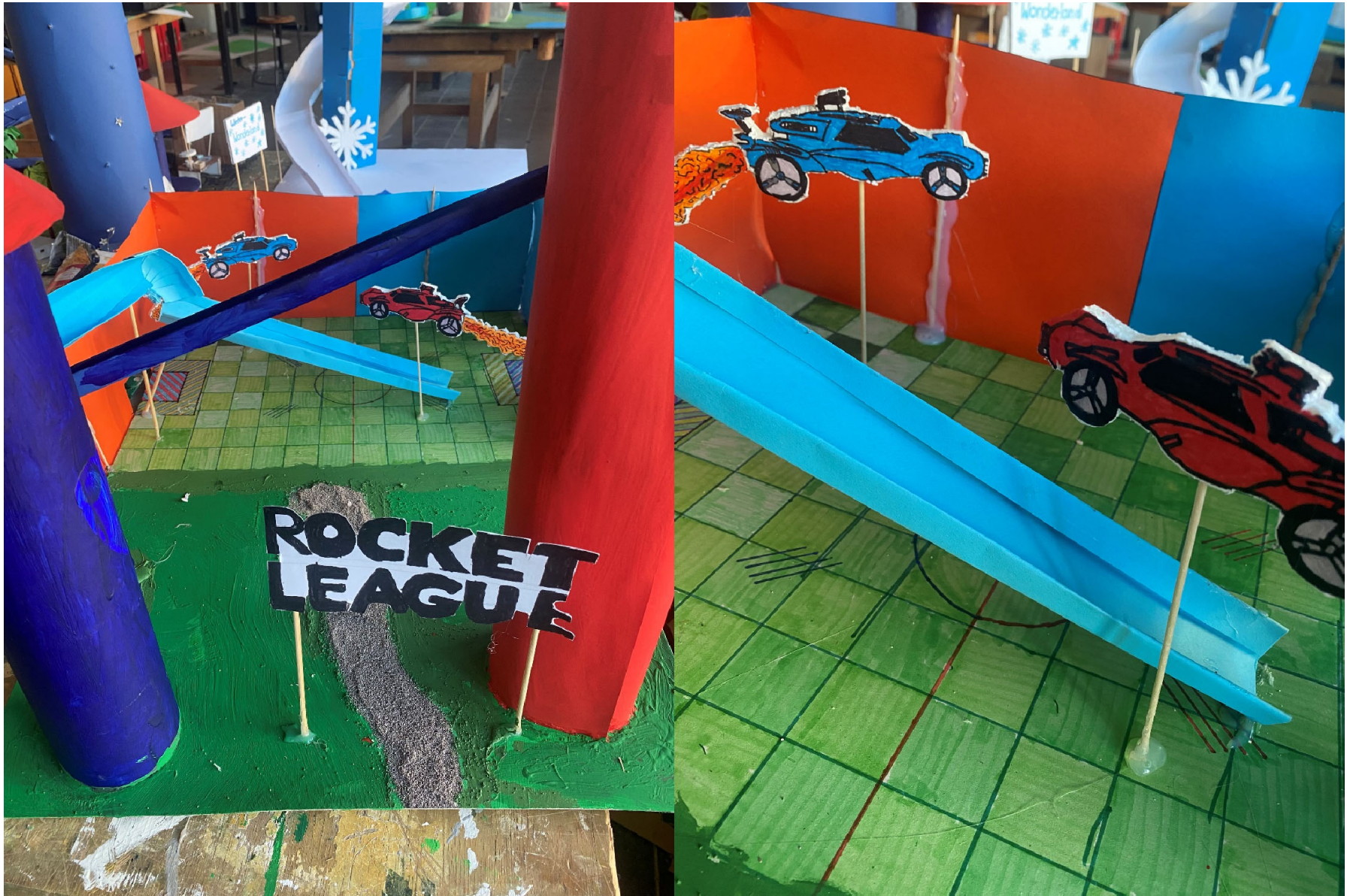
Rocket League (7b)