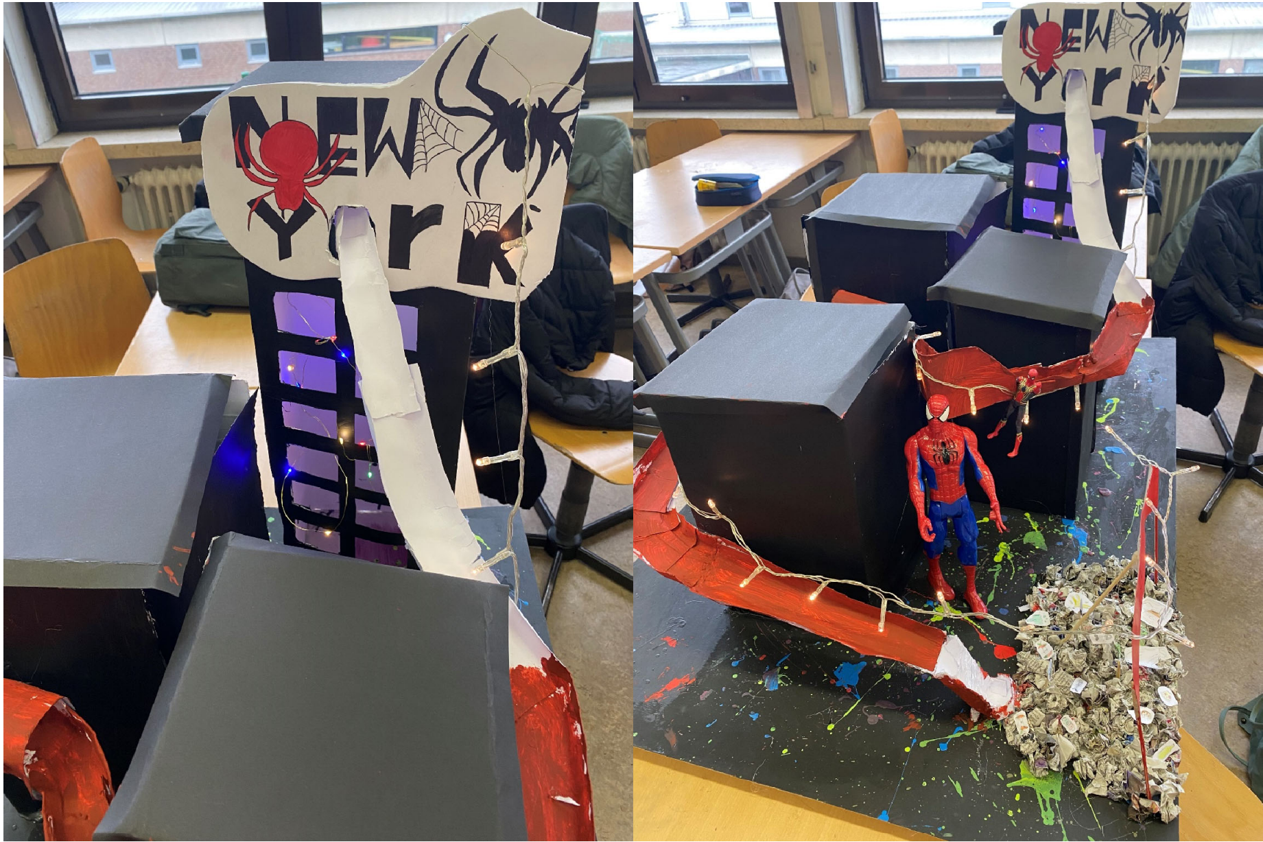
New York (7a)