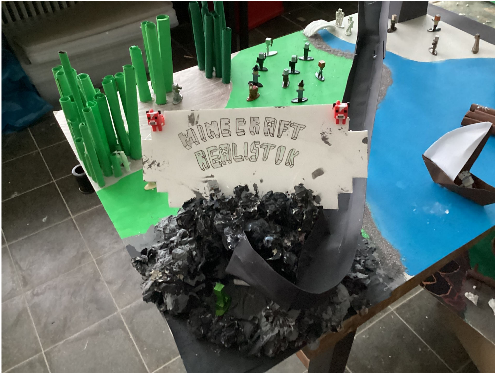
Minecraft Realistik (7a)